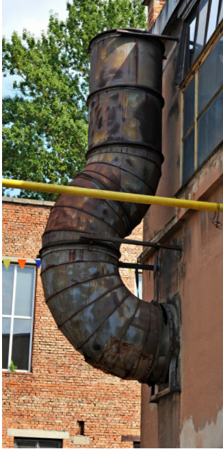
Viele Unternehmen legen Wert auf «spannende» Gebäude für ihre Unternehmensbasis.

IN EINER ZUNEHMEND DIGITAL GEPRÄGTEN WIRTSCHAFT SPIELT DER WOHNORT HEUTE KEINE SO GROSSE ROLLE MEHR. DAZU KOMMT EIN STETIG WACHSENDER FACHKRÄFTEMANGEL, SODASS FIRMEN HEUTE ÜBERLEGEN, SICH DORT ANZUSIEDELN, WO DIE HÖCHSTE VERFÜGBARKEIT VON FACHKRÄFTEN IST. DAS BLEIBEN WOHL NOCH LÄNGER URBANE GEBIETE, AUCH WENN SICH DER TREND IN DER COVID-PANDEMIE ABSCHWÄCHTE.